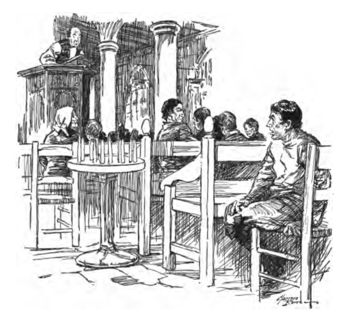
33. EL CANAL DE SUEZ

El proyecto del canal moderno a través del istmo de Suez, para facilitar el paso de los buques desde el Mediterráneo al Mar Rojo, nació de Napoleón el Grande durante su invasión de Egipto. Pero muchísimos siglos antes 5 de él, esto es, 1,300 años antes de la Era cristiana, se construyó un canal desde un ramal